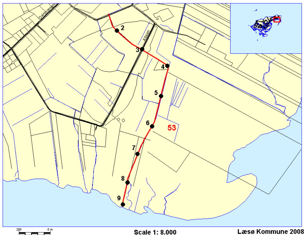
Oversigtskort over stationsplacering for vandløb nr.53 Evbakkestrøm