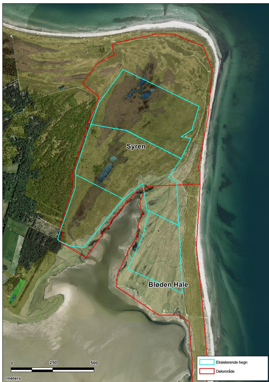
Kortet viser det eksisterende hegn på Syren og Bløden Hale.

Målsætningen er her at opretholde det eksisterende hegn til afgræsning. Afgræsning vil være gunstig for naturtyperne, og området kan være svært tilgængeligt med maskine. Derfor sikres en vedvarende naturpleje gennem afgræsning.