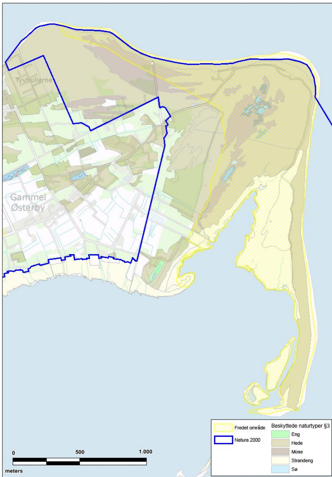
Kortet viser fredningen og offentlige udpegninger i Danzigmann-området. Plejeplanens geografiske afgrænsning er vist med en lilla streg.