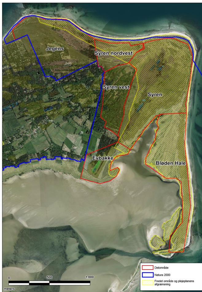
Kortet viser delområderne i Danzigmann.

Delområderne er: Jegens, Syren nordvest, Evbakke, Syren, Syren vest og Bløden Hale. Indledningsvist findes et kort afsnit om naturpleje af klitter og strande.